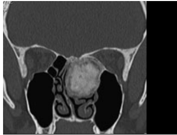
Bildgebung - CT koronar