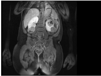
Bildgebung - frontal