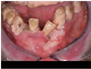
Makroskopie - Bild 1