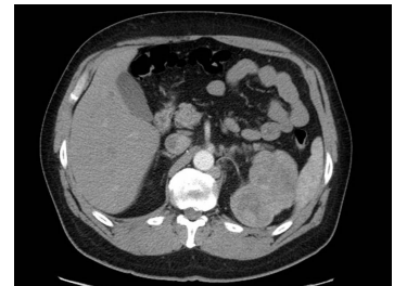
Bildgebung - CT