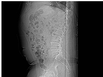
Bildgebung - Röntgen