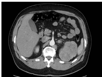
Bildgebung - CT