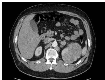
Bildgebung - CT