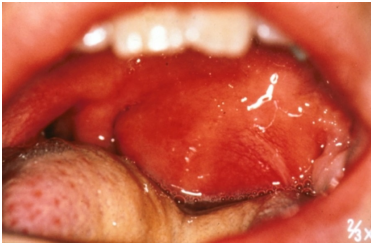
Makroskopie - Untersuchung des Oropharynx