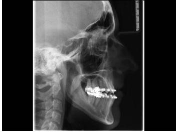
Bildgebung - Fernröntgenseitenbild präoperativ

Bildgebung - Fernröntgenseitenbild prä(...)