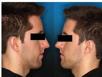
Makroskopie - extraoral