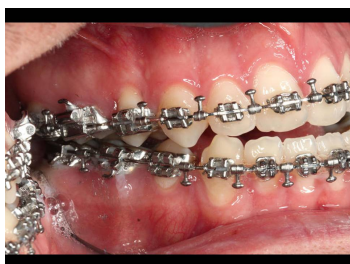
Makroskopie - intraoral