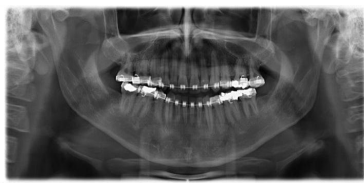
Bildgebung - OPAN präoperativ