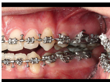
Makroskopie - intraoral