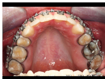
Makroskopie - intraoral