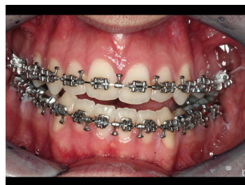
Makroskopie - intraoral