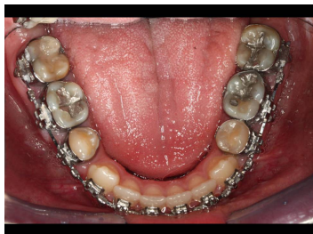
Makroskopie - intraoral