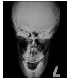
Bildgebung - Clementschiß präoperativ