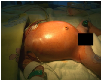
Makroskopie - Inspektionsbefund präoperativ

Makroskopie - Inspektionsbefund präoper(...)