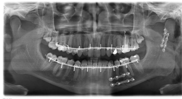
Bildgebung - OPAN postoperativ