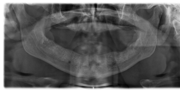
Bildgebung - OPAN präoperativ