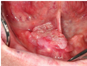
Makroskopie - präoperativ intraoral