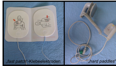
Makroskopie - Defibrillationselektroden