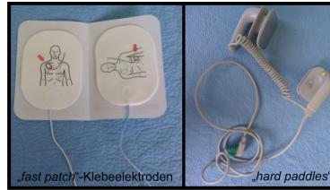
Makroskopie - Defibrillationselektroden