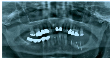
Bildgebung - OPAN postoperativ