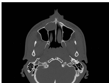
Bildgebung - CT axial präoperativ