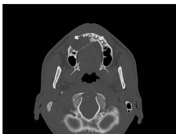
Bildgebung - CT axial präoperativ