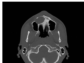
Bildgebung - CT axial präoperativ