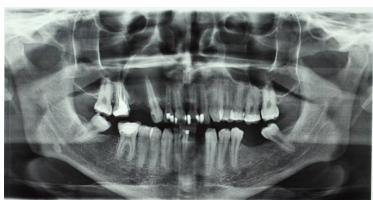
Bildgebung - OPAN präoperativ