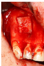
Makroskopie - intraoperativ