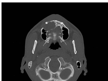
Bildgebung - CT axial präoperativ