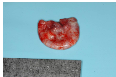
Makroskopie - intraoperativ