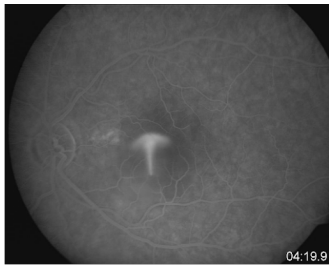
Eile mit Weile_2