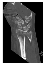
CT Handgelenk anterior/posterior Schnitt 4