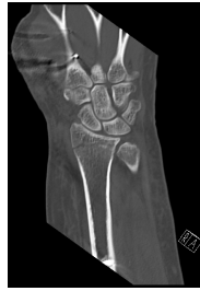
CT Handgelenk anterior/posterior Schnitt 6