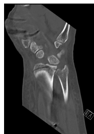
CT Handgelenk anterior/posterior Schnitt 2