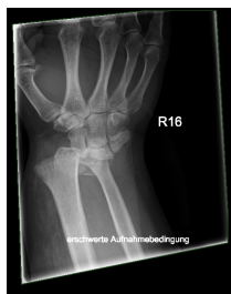
Röntgen distaler Unterarm mit Handgelenk anterior/posterior rechts

Distaler Unterarm mit Handgelenk a.p. re(...)