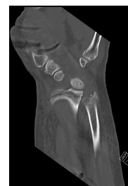
CT Handgelenk anterior/posterior Schnitt 1