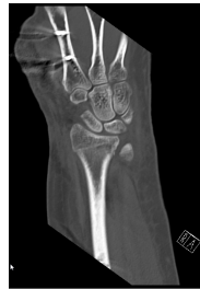
CT Handgelenk anterior/posterior Schnitt 9