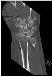
CT Handgelenk anterior/posterior Schnitt 5