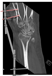
CT Handgelenk Fixateur externe schematisch