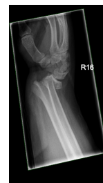
Röntgen distaler Unterarm mit Handgelenk seitlich rechts

Distaler Unterarm mit Handgelenk a.p. re(...)