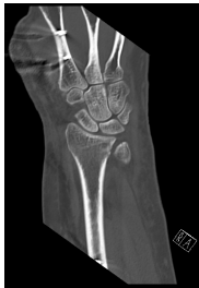
CT Handgelenk anterior/posterior Schnitt 8