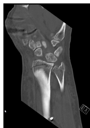
CT Handgelenk anterior/posterior Schnitt 3