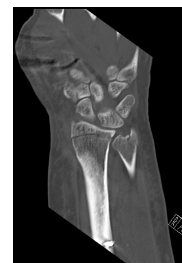
CT Handgelenk anterior/posterior Schnitt 4