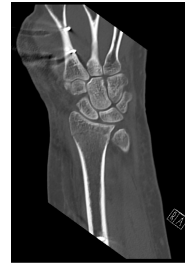
CT Handgelenk anterior/posterior Schnitt 7