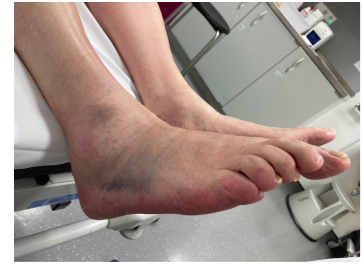
Inspektionsbefund 3 Fuß rechts