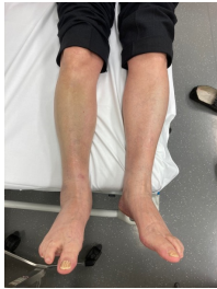
Inspektionsbefund 1 Untere Extremitäten