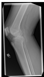
Röntgen proximaler Unterschenkel mit Knie rechts seitlich