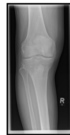
Röntgen proximaler Unterschenkel mit Knie rechts anterior/posterior