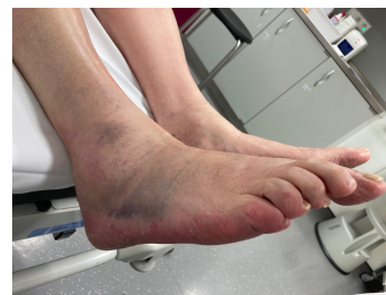
Inspektionsbefund 3 Fuß rechts