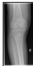
Röntgen proximaler Unterschenkel mit Knie rechts anterior/posterior