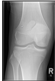
Röntgen Knie rechts 2 Ebenen a.p.