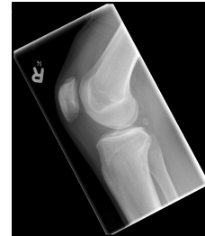
Röntgen Knie rechts 2 Ebenen seitlich