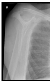
Röntgen Schulter rechts Y-Aufnahme