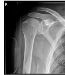
Röntgen Schulter rechts a.p.