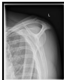
Röntgen Alexanderaufnahme links