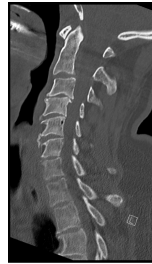
Ausschnitt aus dem initial durchgeführten CT der Halswirbelsäule (HWS)