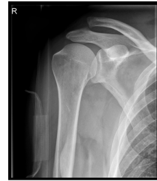
Röntgen Schulter rechts a.p.