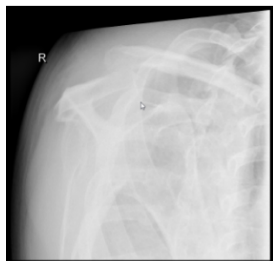
Röntgen Alexanderaufnahme rechts