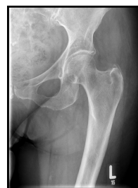
Röntgen Hüfte links a.p.