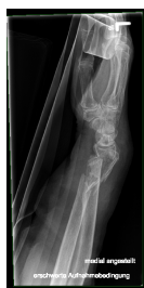
Röntgen Unterarm ganz links seitlich