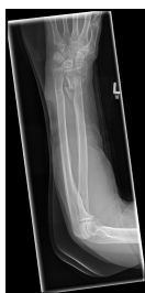
Röntgen Unterarm ganz links a.p.