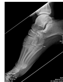
Röntgen Fuß rechts seitlich mit Markierung

Röntgen Fuß rechts seitlich mit Markier(...)