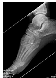
Röntgen Fuß rechts seitlich mit Markierung

Röntgen Fuß rechts seitlich mit Markier(...)