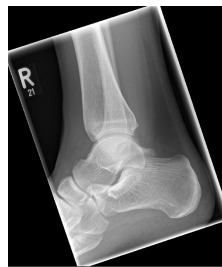
Röntgen OSG rechts seitlich