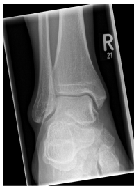
Röntgen OSG rechts a.p.