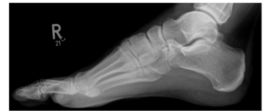
Röntgen Fuß rechts seitlich