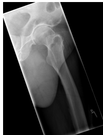
Röntgen Hüfte links axial