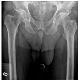
Röntgen Becken tief